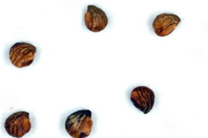
Figure 2.— Akènes de Potentilla supina subsp. tunetica (récolte du 28 mai 2007 à Draâ Boultif).

Dans ses travaux, Soják (1993, 2005) indique que dans l'aire englobant le sud de l'Europe, l'Afrique et l'Asie centrale, n'apparaît pas qu'une seule sous-espèce particulièrement pubescente avec des akènes ayant une protubérance conique, mais plutôt trois sous-espèces de base et quatre sous-espèces de transition (probablement d'origine hybride) ayant toutes la même pubescence et protubérance conique. Parmi ces caractères, la densité de la pubescence serait sous le contrôle du milieu, et seule l'ornementation de l'akène constituerait un critère taxinomique distinctif.