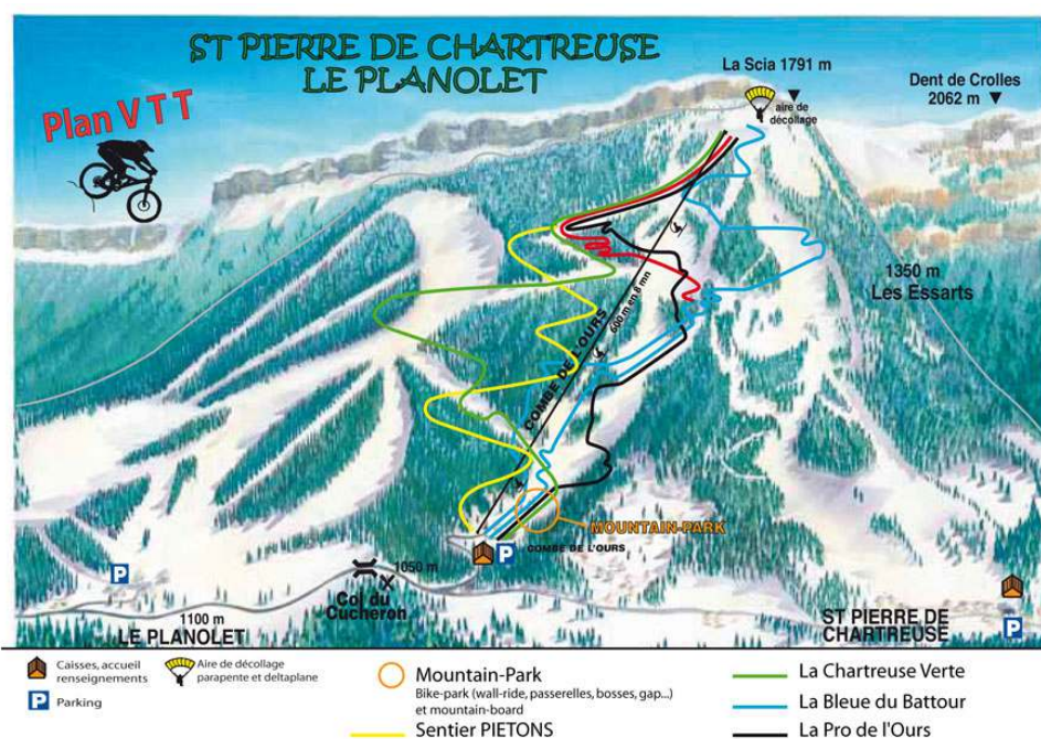
Figure 1 : Plan des pistes de VTT de descente

les aménagements réalisés ont permis l'investissement du site par une nouvelle activité avec l'arrivée de pratiquants autonomes. Le site de pratique est devenu par la suite un spot reconnu car "le spot est autant fait par les pratiquants que par les propriétés physiques qui font le spot" (Rech, Briot et Mounet, 2009). Comme l'explique en effet un internaute : "Le nombre de pistes est assez limité (une piste de chaque couleur avec quelques variantes possibles), mais la difficulté est bien dosée. De la noire très technique à la verte qui serpente en sous-bois, tout le monde y trouve son compte : confirmés, débutants, etc."