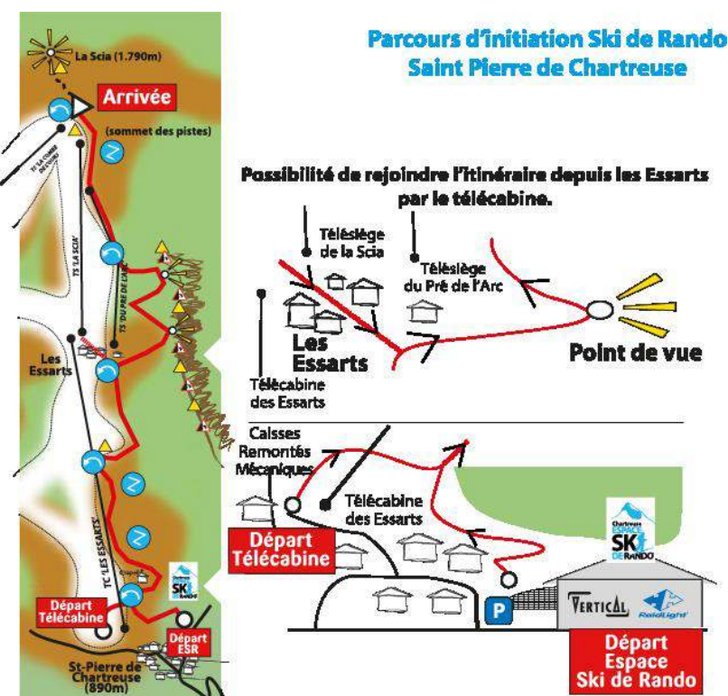
Figure 3 : Itinéraire du parcours d'initiation de ski de randonnée

ski de randonnée, puisque de nombreux trailers font du ski de randonnée l'hiver. Cependant, l'objectif et la cible visée sont beaucoup plus larges ; en effet, "le but est d'initier les gens pour qu'ils puissent ensuite pratiquer en montagne", "beaucoup de gens veulent se mettre au ski de rando ; ils aimeraient s'y mettre mais ils ne savent pas comment faire, parce que c'est compliqué". L'objectif est aussi commercial, car la société Raidlight, spécialisée dans la fabrication de vêtements et de chaussures pour le trail, a racheté, en 2010, la société Vertical, elle-même spécialisée dans la fabrication de vêtements de montagne. Ce projet a rapidement reçu l'adhésion du PNR de Chartreuse et de la communauté de communes puisque, en répondant "au souhait de la clientèle touristique demandeuse de séjours multi-activités", il faisait écho à leur objectif de diversification touristique. Pour mener à bien ce projet, Raidlight a sollicité l'accord de l'ONF pour l'usage des chemins forestiers menant au sommet de la station et en faire ainsi des itinéraires de montée qui n'empiètent pas sur le domaine skiable.