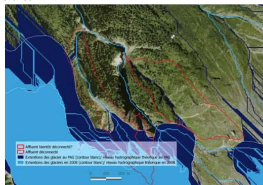
Réseau hydrographique provenant des glaciers au petit âge glaciaire et en 2008. Exemple du torrent de la Creusaz, glacier des Bossons J.Berthet